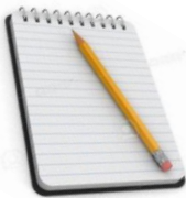
Libreta y lápiz