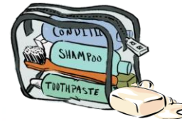
Artículos de higiene personal (cepillo y pasta dental, jabón, champú)