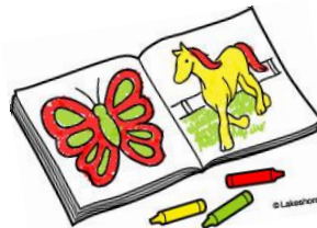
Libro de colorear y crayones