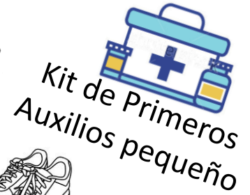
Kit de Primeros Auxilios pequeño