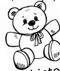
Objeto reconfortante (pequeño peluche)