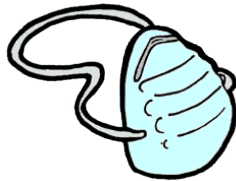
Mascarilla para polvo