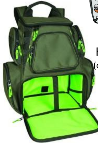
Mochila con muchos bolsillos (ayuda a conservarla organizada)